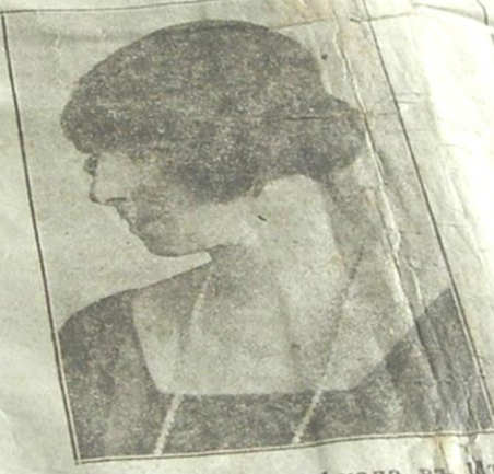
Принцесса Елена въѣхала въ Милано во Флоренцію