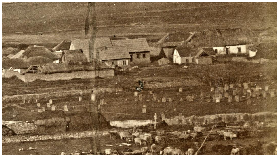
Photo of Old Kaushany cemetery